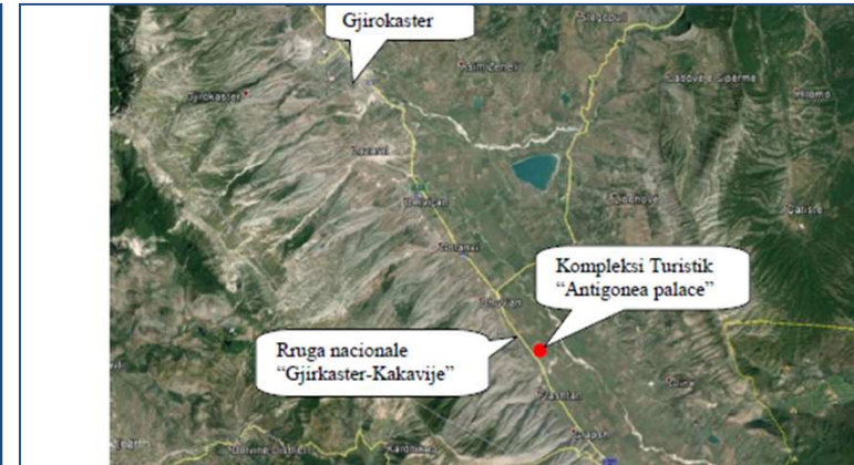
4.2. Planvendosja e prones