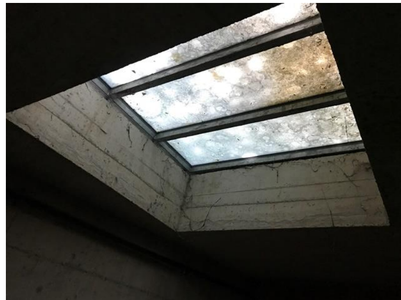
Dritaret nga brenda ambjentit