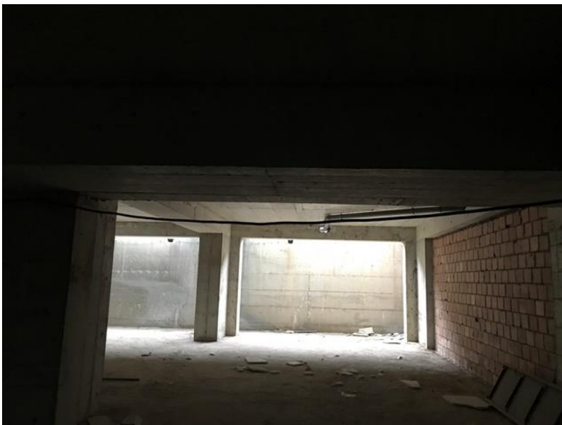
Dritaret nga brenda ambjentit